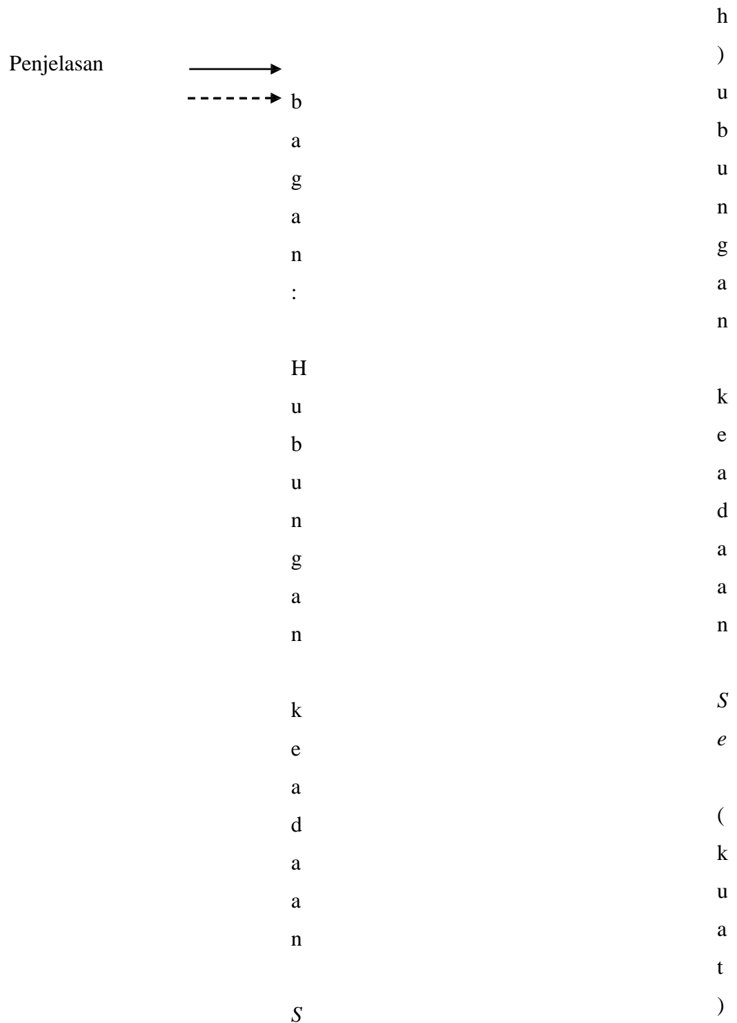
Gambar 5.1 Bagan Hubungan Hati dengan Organ Zhang lain (San, dkk., 1985).

1. Karena Hati dalam keadaan Se , maka Yang Hati menjadi terlalu kuat. Hal ini menyebabkan terjadinya Api dan Angin.