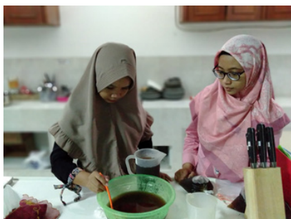
Gambar 5. Demo pengolahan limbah batang Nanas oleh tim

Setelah proses pengolahan limbah organik batang nanas, maka proses akan dilanjutkan dengan tahap pelatihan pengolahan tepung nanas menjadi makanan ringan yang sehat, berupa snack bar . Kegiatan ini menggunakan bentuk kegiatan demo masak.