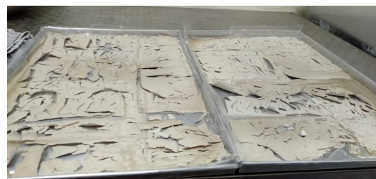
Gambar 3. Pati batang nanas yang dikeringkan dalam oven