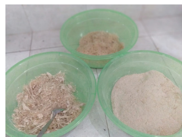
Gambar 4. Batang nanas yang telah dihaluskan menjadi tepung (kanan), tepung bonggol nanas yang setengah halus (atas), dan serat kasar bonggol nanas (kiri)