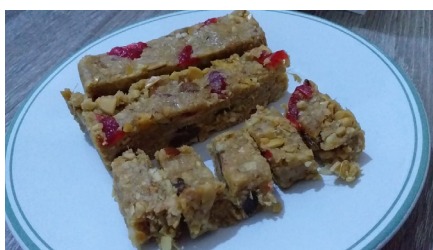
Gambar 6. Snack bar dengan olahan tepung batang nanas

Setelah proses pengolahan limbah organik batang nanas, maka proses akan dilanjutkan dengan tahap pelatihan pengolahan tepung nanas menjadi makanan ringan yang sehat, berupa snack bar . Kegiatan ini menggunakan bentuk kegiatan demo masak.