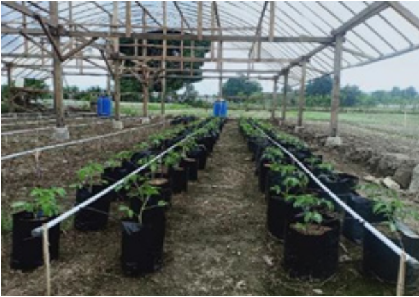
Gambar 4. Instalasi hidroponik sistem drip irrigation pada tanaman melon (atas) dan tomat (bawah)

Pemeliharaan dan pemanenan. Bibit tomat dan melon dipelihara selama 70 hari dengan memberikan nutrisi AB mix dengan konsentrasi sesuai dengan fase pertumbuhan tanaman tomat dan melon. Pemberian nutrisi dilakukan secara otomatis menggunakan timer selama 10 menit untuk menghasilkan volume nutrisi 200 ml. Berikut ini adalah pertumbuhan tomat dan melon dalam masa pemeliharaan (Gambar 5).