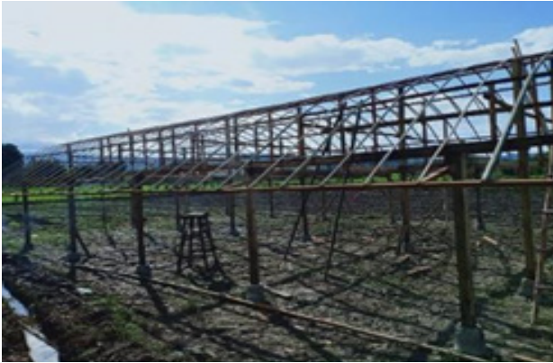
Gambar 2. Green house yang akan digunakan untuk budidaya tomat dan melon secara hidroponik dengan sistem drip irrigation

Poso dengan dana dari Tim PkM Fakultas Sains dan Teknologi, Universitas Airlangga; sedangkan pembuatan green house dibantu oleh tenaga pekerja. Pembuatan green house memerlukan waktu cukup lama karena menunggu pemesanan kayu dan pengiriman plastik UV. Hasil pembuatan green house dapat dilihat pada Gambar 2.