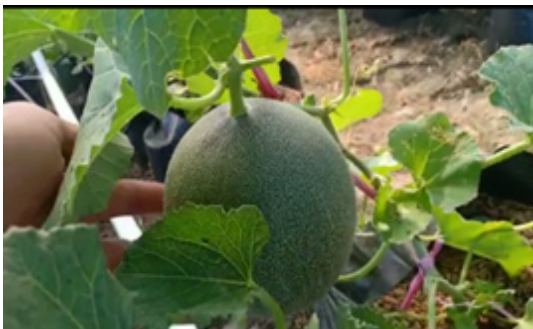
Gambar 5. Pertumbuhan tanaman tomat dan melon hidroponik sistem drip irrigation di dalam green house

Tomat hasil hidroponik sistem drip irrigation dapat dipanen pada umur 50-60 hari setelah pindah tanam, sedangkan melon dipanen pada umur 70-80 hari setelah pindah tanam. Hasil panen tomat dan melon dapat dilihat pada (Gambar 4). Jumlah buah per tangkai dan diameter buah tomat pada saat pemanenan dapat dilihat pada Tabel 1; sedangkan rata-rata berat buah melon adalah 1,2 kg sampai 1,8 kg. Hasil pengamatan menunjukkan buah tomat yang dihasilkan memiliki kandungan air yang rendah. Rata-rata jumlah buah yang diperoleh (4,05) menunjukkan jumlah yang cukup banyak bila dibandingkan dengan rata-rata jumlah buah tomat yang ditumbuhkan tanpa metode hidroponik (3,5 cm), sedangkan rata-rata diameter buah tomat yang diperoleh yaitu 5,10 cm cukup besar mengingat benih tomat yang digunakan adalah tomat sayur (Tabel 1). Pengaturan pemberian air dalam sistem drip irrigation diperlukan untuk mendapatkan kadar air yang tinggi pada buah tomat dan buah melon; selain itu pengurangan air pada awal proses pematangan buah akan menyebabkan kadar air buah tomat dan melon meningkat (Johnstone et al., 2005; Carsidi et al., 2021).