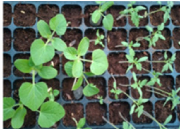
Gambar 3. Bibit tanaman melon dan tomat hasil semai umur 14 hari (kiri) dan tanaman melon dan tomat yang dibudidayakan dengan metode hidroponik sistem drip irrigation (kanan)

Penyemaian benih tomat dan melon. Benih tomat dan melon disemai di dalam tray yang berisi cocopeat, selanjutnya benih dipelihara selama 14 hari, kemudian dipindahkan ke dalam polybag yang didalamnya telah diisi sekam. Dokumen penyemaian benih tomat dan melon dapat dilihat pada Gambar 3. Benih melon yang disemai tidak semuanya mampu berkecambah, sedangkan untuk benih tomat semua benih yang disemai mampu berkecambah. Ketidakmampuan benih berkecambah dipengaruhi oleh beberapa faktor yaitu kualitas benih yang kurang bagus, umur benih dalam penyimpanan, atau kurangnya cahaya selama penyemaian (Isnain, 2019). Kualitas benih sangat dipengaruhi oleh produsen atau penghasil benih; apabila benih diproduksi dari induk yang berkualitas maka hasil benihnya juga akan berkualitas. Saat ini, banyak dijumpai berbagai produsen benih baik dari dalam negeri maupun dari luar negeri. Oleh karena itu diperlukan pengetahuan atau pengalaman dalam memilih benih yang berkualitas. Kegiatan pengabdian kepada masyarakat ini menggunakan benih dari produsen dalam negeri.