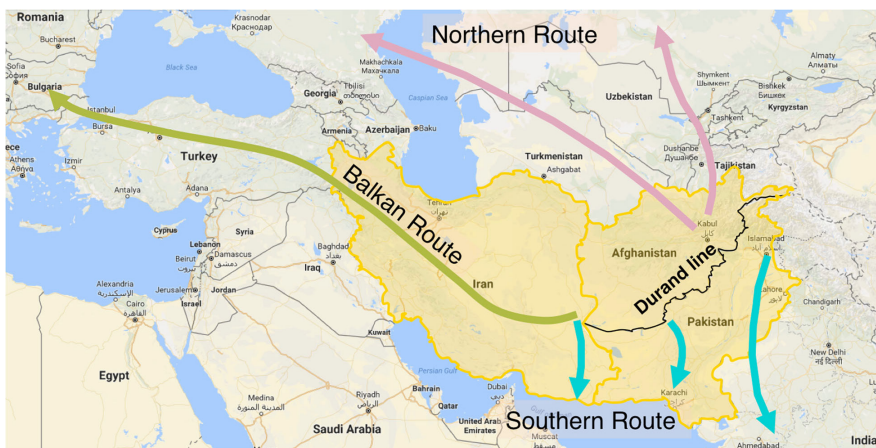
Peta 1. Rute-Rute Perdagangan Narkoba di Kawasan Golden Crescent

berimplikasi pada epidemi penggunaan narkoba dalam jenis suntikan. Lantas, hal ini berpengaruh terhadap peningkatan serta penyebaran human immunodeficiency virus (HIV) yang ditularkan melalui darah. Menurut Farooq et al. (2017), terdapat tiga rute dalam perdagangan heroin yang telah terdefinisi dengan baik dan tiga rute ini berasal dari wilayah Golden Crescent yakni: (1) Rute Balkan, beroperasi melalui Iran dan Turki, menyebabkan perdagangan narkoba di rute ini bisa mencapai Eropa; (2) Rute Utara, yang mana rute ini memasok heroin ke Rusia dan Asia Tengah; (3) Rute Laut Selatan yang memperdagangkan heroin dari Iran dan Pakistan ke seluruh dunia. Dalam Rute Selatan ini, perlu digaribawahi bahwa Afghanistan merupakan negara landlocked , sehingga komoditas dari penjualan narkotikanya harus melewati Pakistan terlebih dahulu. Berdasarkan ketiga rute dari wilayah penyebaran narkoba yang berasal dari Golden Crescent dapat dilihat dalam peta dibawah ini.