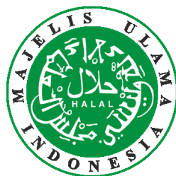
Gambar 2. Logo Halal Majelis Ulama Indonesia

Pemerintah mengeluarkan Peraturan Pemerintah RI Nomor 69 Tahun 1999 tentang Label dan Iklan pangan menerangkan tentang pemasangan Label Halal pada kemasan yang harus melalui pemeriksaan terlebih dahulu oleh lembaga pemeriksa yang terakreditasi berdasarkan pedoman dan tata cara yang ditetapkan Menteri Agama (Afronyati 2014).