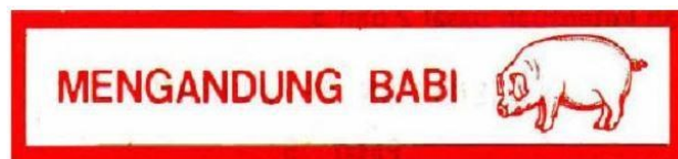
Gambar 1. Tanda peringatan produk berbahan babi

Sebelum adanya sertifikasi halal yang dilakukan oleh Majelis Ulama Indonesia (MUI) pada tahun 1989, labelisasi halal terhadap produk pangan di Indonesia telah dimulai sejak akhir tahun 1976 oleh Kementerian Kesehatan. Tepatnya pada tanggal 10 November 1976 semua makanan dan minuman yang mengandung babi maupun turunannya harus memberikan identitas bahwa makanan tersebut mengandung babi. Hal ini diatur dalam Surat Keputusan Peraturan Menteri Kesehatan Republik Indonesia Nomor 280/Men.Kes/Per/XI/76 mengenai Ketentuan Peredaran dan Penandaan pada Makanan yang Mengandung Bahan Berasal dari Babi. Bagi produsen makanan yang menggunakan babi maupun turunannya harus mencantumkan tanda peringatan pada wadah atau bungkus baik dicetak maupun direkatkan pada kemasan. Tanda peringatan harus memuat dua unsur yaitu adanya gambar babi serta tulisan "MENGANDUNG BABI" yang diberi warna merah dan berada di dalam kotak persegi merah seperti pada Gambar 1.