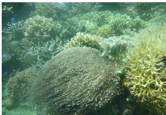
Gambar 1. Kerapatan karang pulau Kangean

terjadinya suksesi lingkungan, yang dalam banyak penelitian selalu menjadi pionir bagi spesies karang yang lain (Oceana, 2006). Dalam suatu ekosistem terumbu karang, pada umumnya terdiri dari banyak spesies karang yang memiliki bentuk bervariasi tetapi laju pertumbuhannya lambat kurang lebih 1 cm/tahun (Beger et al. , 2003).