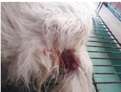
Gambar 1. Discharge sanguino-purulen vagina

Informasi mengenai kasus ini adalah seekor kucing dewasa betina, ras campuran, berumur 7 tahun dengan berat badan 2,5 kg dibawa ke Harmoni Pet Care, Menanggal, Gayungan, Surabaya dengan riwayat kucing tersebut masih mau makan dan terdapat leleran seperti darah keluar dari vagina (Gambar 1).