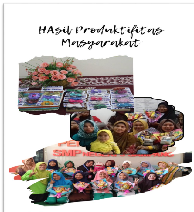
Gambar 6. Hasil produktivitas masyarakat

Kegiatan pelatihan yang diselenggarakan diatas mampu memberikan kontribusi yang nyata bagi kemandirian dan produktivitas guna meningkatkan kualitas hidup bagi masyarakat lingkungan kampus. Salah satu keberhasilan yang ditunjukkan oleh perpustakaan binaan Perpustakaan Universitas Airlangga adalah diraihnya Juara I Perpustakaan Sekolah 2012 yang diadakan Perpustakaan Daerah Surabaya. Hasil dari kreatifitas dan produktivitas masyarakat dapat di lihat pada Gambar 6.