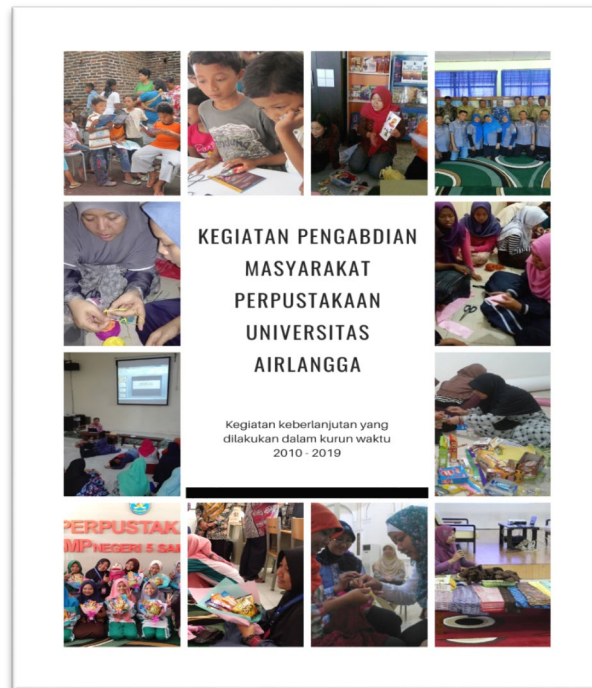
Gambar 5. Kegiatan Pengabdian Masyarakat Perpustakaan Universitas Airlangga

Kegiatan pelatihan yang diselenggarakan diatas mampu memberikan kontribusi yang nyata bagi kemandirian dan produktivitas guna meningkatkan kualitas hidup bagi masyarakat lingkungan kampus. Salah satu keberhasilan yang ditunjukkan oleh perpustakaan binaan Perpustakaan Universitas Airlangga adalah diraihnya Juara I Perpustakaan Sekolah 2012 yang diadakan Perpustakaan Daerah Surabaya. Hasil dari kreatifitas dan produktivitas masyarakat dapat di lihat pada Gambar 6.