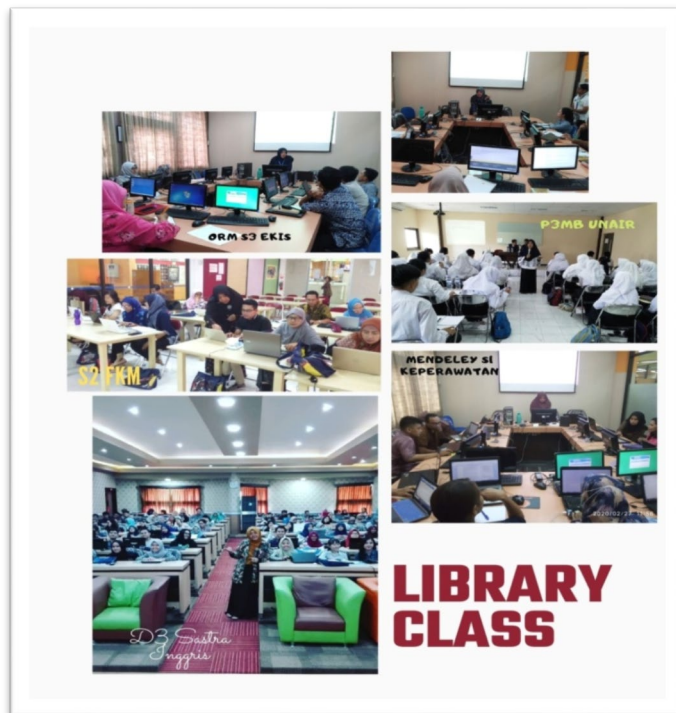
Gambar 3. Kegiatan Library Class