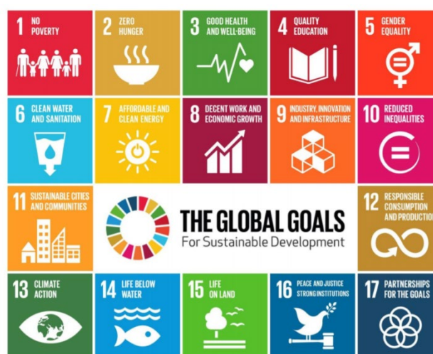
Gambar 1. The Global Goals for sustainable Development, (sumber : www.globalgoals.org )

Sebagai upaya perpustakaan dalam mendukung lembaga tinggi dalam hal ini adalah universitas, maka perpustakaan harus terlibat dan menjadi bagian dalam ketiga unsur tersebut. Berdasar atas hal tersebut diatas maka tulisan ini akan membahas tentang literasi informasi untuk kesejahteraan. Ruang lingkup tulisan ini adalah kegiatan-kegiatan ( best practice ) yang telah dilakukan di Perpustakaan UNAIR sebagai upaya mendukung pelaksanaan Tri Dharma Perguruan Tinggi. Rumusan masalah dalam tulisan ini adalah bagaimanakah pelaksanaan kegiatan literasi informasi untuk kesejahteraan di Perpustakaan Unair sebagai upaya untuk mendukung tri dharma perguruan tinggi, sehingga nantinya tulisan ini nanti akan memberikan gambaran bagaimana pelaksanaan literasi informasi guna mendukung pelaksanaan Tri Dharma Perguruan Tinggi di Universitas Airlangga. Masyarakat literat ( literate society ) adalah sebuah agenda besar dunia yang telah dicanangkan oleh UNESCO. Agenda besar ini terdapat dalam Sustainable Development Goals (SDGs) yang memiliki 17 tujuan dengan 169 target dan 241 indikator.(The global goals for sustainable development, n.d.)