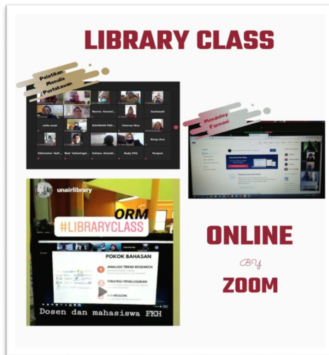
Gambar 4. Kegiatan Library Class Online di masa Pandemi

Literasi informasi di Perpustakaan Universitas Airlangga yang bertajuk Library Class telah mampu mengubah pemikiran sivitas akademika UNAIR menjadi lebih kritis dalam memilah sumber informasi yang digunakan sebagai bahan rujukan dengan mengikuti kelas Online Research Management, mampu memahami perbedaan antara e-journal dan platform pengindeksan jurnal. Penyelenggaraan kelas tersebut mampu membantu sivitas akademika