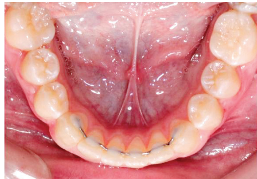
Gambar 4. Bonded Lingual Retainer (Goenharto dan Rusdiana, 2015)

Ada 2 macam kawat busur yang digunakan untuk BLR yaitu buatan pabrik dan dibuat sendiri yang disesuaikan dengan geligi pasien. Retensi jenis ini jarang menimbulkan keluhan, tetapi kadang-kadang juga dapat menyebabkan kerusakan biologis. Ditemukan 4 tahun setelah perawatan ortodonti, peranti retensi lingual yang patah bisa mengakibatkan torsi akar ke bukal, sehingga apeks gigi bagian bukal hampir keluar dari tulang (Yanes et al., 2008) Kegagalan peranti retensi cekat dapat berupa relaps ringan yang disebabkan oleh fraktur pada komposit maupun kawat dan ketidakmampuan menahan posisi gigi (Cerny et al., 2010).