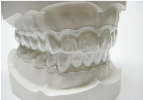
Gambar 3. Clear retainer (Iswari, 2012)

Invisible retainers diperkenalkan pertama kali oleh Robert Ponitz dari Michigan. Peranti ini cukup efektif untuk mempertahankan posisi apikal gigi insisif dan gigi rotasi yang sudah terkoreksi. Peranti dibuat melingkupi keseluruhan lengkung geligi. Umumnya invisible retainers atau yang biasa disebut clear retainer dibuat dari selembar bahan semacam plastik yang dipanaskan dan dipres pada permukaan model kerja (Gambar 3).