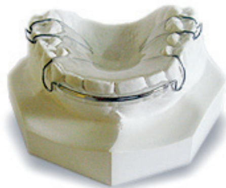
Gambar 1. Modifikasi peranti retensi Hawley (Mitchell, 2013)