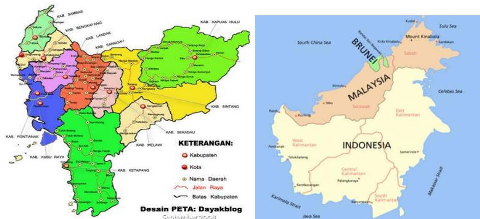
Gambar 1. Peta daerah penelitian