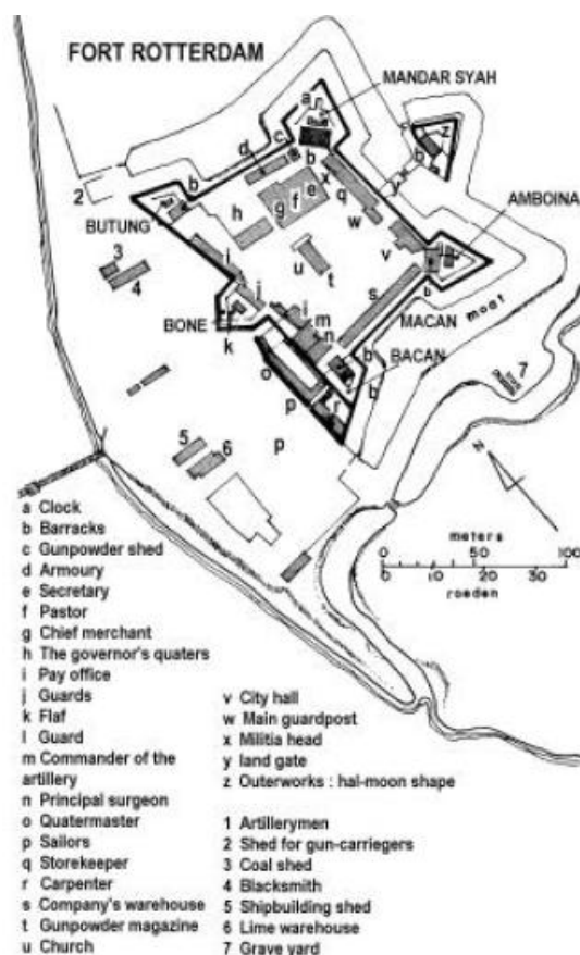
Gambar 5. Kawasan Fort Rotterdam Makassar yang merupakan pusat kekuasaan VOC sejak abad ke-17

Sejalan dengan makin kuatnya pengaruh pemerintahan kolonial di Kota Makassar, pendirian bangunan baru milik pemerintah atau swasta juga semakin kelihatan. Meskipun demikian, hingga akhir abad ke-18 struktur tata kota tidak banyak mengalami perubahan, sebab lingkungan di sekitar Benteng Fort Rotterdam masih menjadi lingkungan yang eksklusif bagi VOC.