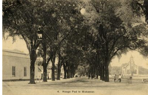
Gambar 6. Jalan Hooze Pad, Makassar; tampak bangunan gereja

gedung lain dengan bahan batu, yakni di sebelah selatan lapangan Karebosi, sehingga membentuk pola struktur kota.