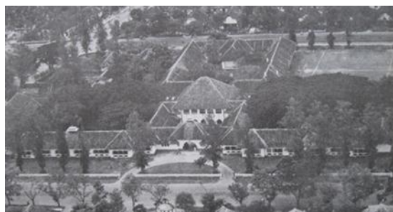
Gambar 4. HBS Surabaya di Ketabang, saat ini digunakan sebagai tempat SMAN 2 Surabaya