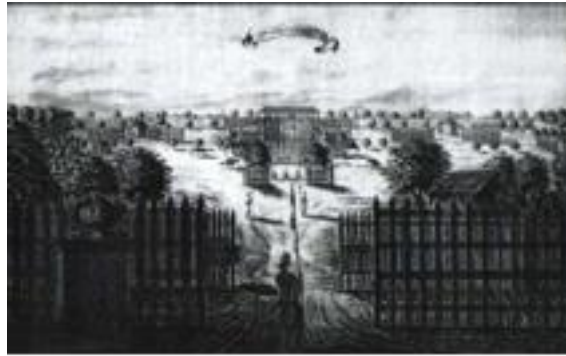
Gambar 8. Kawasan Kraton Yogyakarta pada Periode Awal

mancanegara dan daerah pesisir merupakan daerah yang jauh dari pusat kota yang dipimpin oleh bupati yang tidak diangkat langsung oleh Sultan dan juga tidak bertanggung jawab langsung pada Sultan, tetapi wajib menghadap dan memberikan hadiah istimewa pada Sultan beberapa kali dalam setahun sebagai wujud kesetiannya. Dengan demikian, aktivitas negara-kota ini menjadikan Yogyakarta sebagai ibukota yang menjadi basis pemerintahan dan sekaligus perkembangan kebudayaan Yogyakarta.