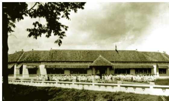
Gambar 7. MULO Makassar Tahun 1924

maupun anak-anak bumiputera. Mereka yang diterima di MULO harus sudah mahir berbahasa Belanda (Dinas Kebudayaan dan Pariwisata Propinsi Sulawesi Selatan 2003:24).