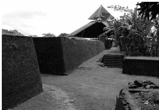
Gambar 2. Sisa-sisa Benteng Somba Opu di Kabupaten Gowa

Kawasan kraton dikelilingi oleh benteng yang kuat yang memiliki beberapa pintu yang disebut plengkung (Basundoro 2012a:66). Tidak terlalu jauh dari area kraton terdapat pula tempat pesiar keluarga kerajaan yang disebut Tamansari. Kawasan tersebut pada mulanya berupa kolam raksasa yang diselingi bangunan-bangunan untuk kegiatan tertentu, sehingga dikenal dengan julukan castle on the water . Bangunan kraton, benteng, dan kompleks Tamansari saat ini telah ditetapkan sebagai bangunan cagar budaya. Di kota Makassar peninggalan periode tersebut terkonsentrasi di kawasan Benteng Somba Opu yang merupakan kawasan pusat Kerajaan Gowa (Matulada 2011:14).