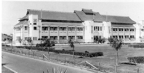
Gambar 3. Balai Kota Surabaya pada Masa Kolonial

cagar budaya tipe A. Balai Kota Surabaya merupakan gedung yang sangat megah, dirancang oleh arsitek G.C. Citroen, seorang arsitek kelahiran Amsterdam yang menetap di kota Surabaya sejak tahun 1915 (Handinoto 1996:192).