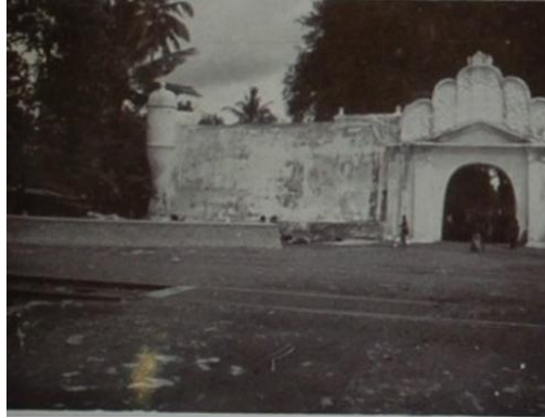
Gambar 1. Plengkung Benteng Kraton Yogyakarta

berlangsung di Makassar, setidaknya terdapat 16 raja yang memimpin Kerajaan Gowa.