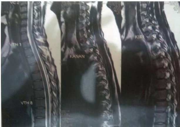
Gambar 1. MRI Whole Spine Tanpa Kontras Bagian Cervicothorakal