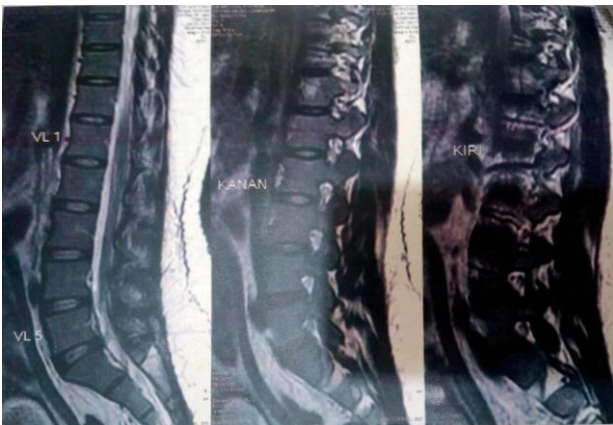
Gambar 2. MRI Whole Spine Tanpa Kontras Bagian Lumbosacral