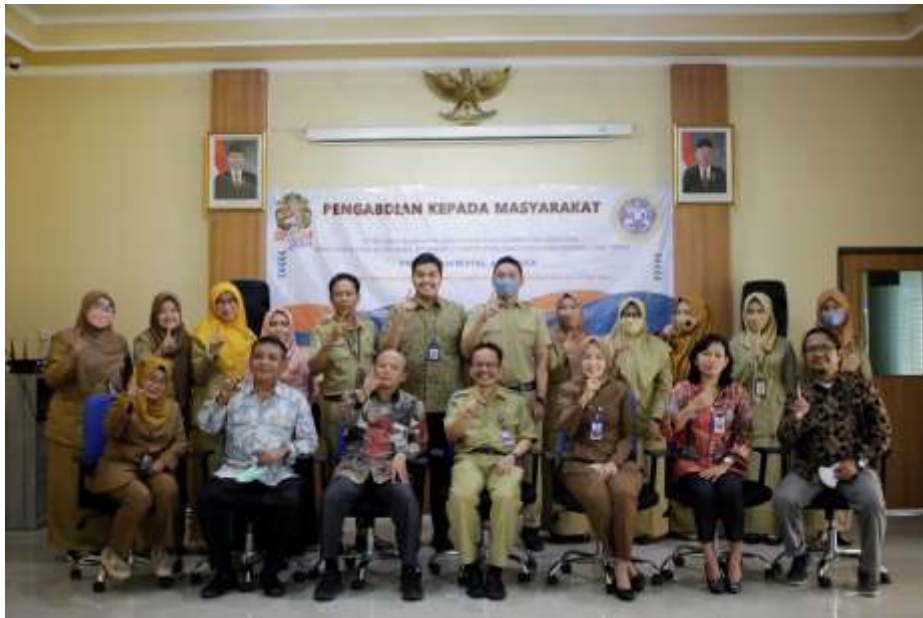
Gambar 2: Kegiatan Pengabdian Masyarakat di BPSDM Jatim