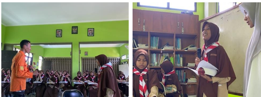
Gambar 2. Sesi tanya jawab dan pemaparan kesimpulan materi oleh peserta didik.