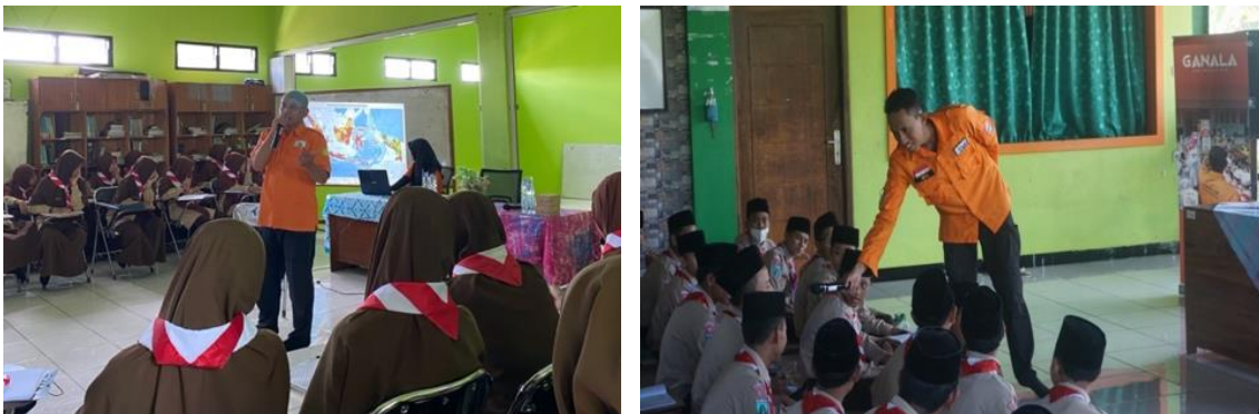
Gambar 1. Sosialisasi mitigasi bencana angin puting beliung dan gempa bumi.

Kegiatan sosialisasi dan simulasi mitigasi bencana dilakukan pada 25 November 2022 secara tatap muka di SMP Ibnu Batutah Madiun yang terletak di Kecamatan Sawahan, Kabupaten Madiun. Peserta terdiri dari 53 siswa, 70 siswi, dan 13 ustaz/ustazah, hingga kepala sekolah. Sosialisasi disampaikan dua materi secara bergantian, yaitu angin puting beliung dan gempa bumi. Karena merupakan sekolah tahfidz, tempat pelaksanaan antara siswa dan siswi dipisahkan. Materi sosialisasi diharapkan mampu meningkatkan pengetahuan dan kesadaran para siswa dan guru terkait Pendidikan Pengurangan Risiko Bencana (PRB). Melalui sektor pendidikan, diharapkan dapat mengurangi risiko bencana dengan mencapai target yang lebih luas dan dikenal lebih dini oleh peserta didik, yang pada akhirnya mampu berkontribusi terhadap kesiapsiagaan komunitas sekolah terhadap bencana.