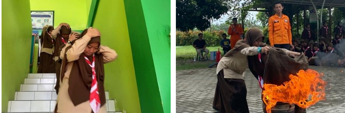
Gambar 4. Praktik simulasi mitigasi gempa bumi dan kebakaran.

Tim panitia juga turut membantu menentukan dan menandai jalur evakuasi dan titik kumpul untuk mempermudah jalannya simulasi. Untuk praktik mitigasi kebakaran, didukung pula dengan kelengkapan alat-alat seperti tabung gas, bensin, tong untuk dibakar, Alat Pemadam Api Ringan (APAR), dan alat perlindungan diri (APD).