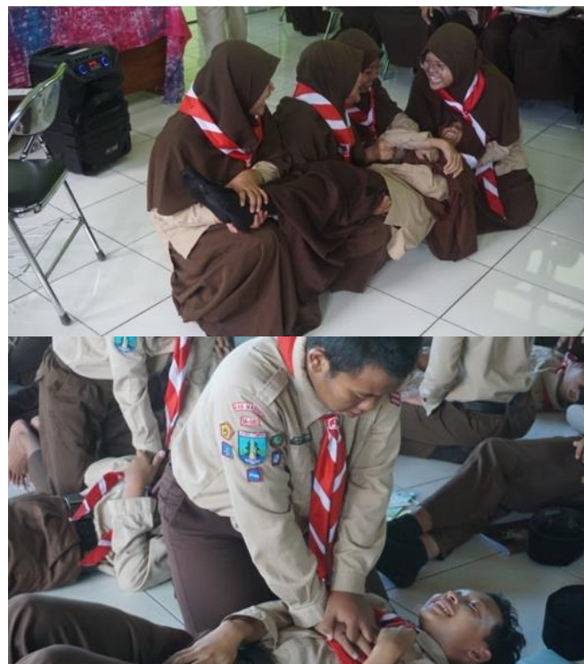
Gambar 3. Praktik materi Bantuan Hidup Dasar (BHD).

Pada sesi sosialisasi, peserta didik diberikan materi antara lain: 1) pengertian dan macam-macam bencana; 2) faktor-faktor penyebab bencana; 3) ciri-ciri sebelum terjadinya bencana; 3) hal-hal yang harus dilakukan maupun dihindari saat dan sesudah terjadi bencana; 4) dampak setelah terjadinya bencana; dan 5) menyanyikan lagu mitigasi bencana beserta gerakannya. Peserta juga dikenalkan dengan barang-barang yang wajib dibawa dalam tas siaga, seperti dokumen penting, kotak P3K, obat pribadi, senter, makanan siap saji, dan lain sebagainya. Sesi terakhir dalam kegiatan ini adalah tanya jawab dan peserta didik memaparkan kesimpulan dari materi yang disampaikan.