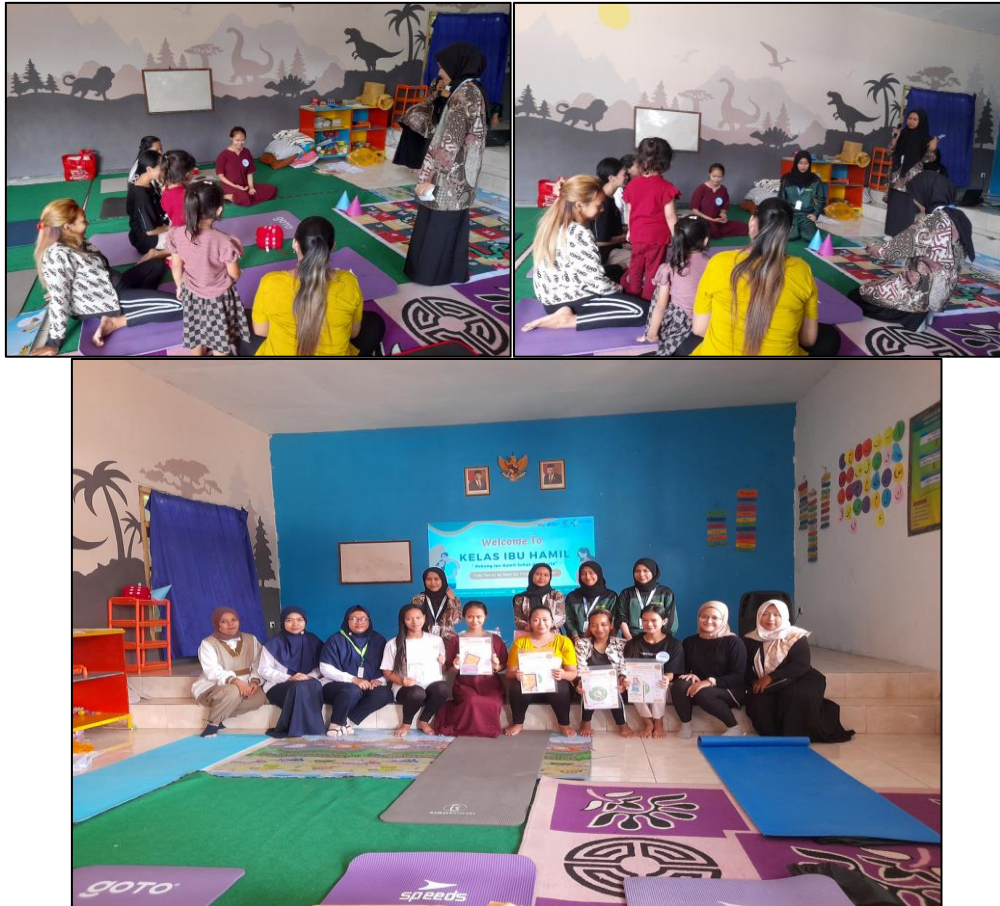
Gambar 2. Dokumentasi Kegiatan “PEKAN BUMI BERCEKITA”.